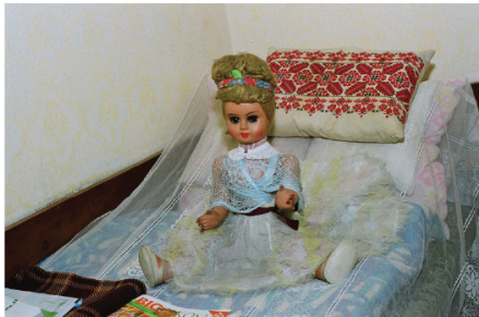
黄金时代里，莉拉用直视的镜头吸引我们去注意老年公寓里的老人们，她常故意拍摄和主人一样年老的物品，让这些物件对我们讲述故事和爱。