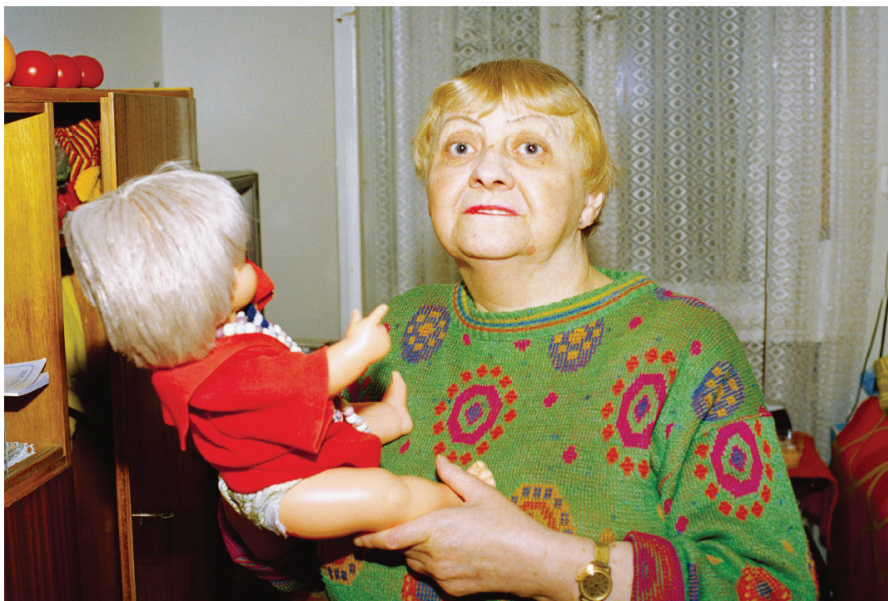
萨斯·莉拉《黄金时代》

当摄影师萨斯·莉拉第一次走进苏珊阿婆的寓所时，她感觉到了一座时光博物馆。在那只咖啡色的简易壁柜里，摆放着各式各样的玩偶，从色泽和款式来看，它们显然诞生于半个多世纪前。那个挽着高高发髻的新娘子玩偶，它的婚纱已被洗得发黄，裙摆露出参差不齐的纱须。这也许是某年的生日聚会上，苏珊的祖母送给苏珊的礼物吧。莉拉默默地猜想着。而让她吃惊的是，在这些依旧散发着童趣的摆设中，居然还有一个小小的祭坛。年轻男子的肖像照被各种表情奇趣的玩偶们围绕着。