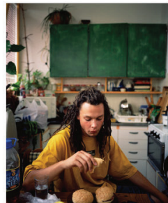
翰劳科尼·索博尔奇《无矿井的矿区》，表现东欧社会变革后生活在被废弃的矿区里的年轻人

在和这个家庭相处的四年中，莉拉看到了他们的快乐和烦恼，其实他们也有着单纯的感情。很多卖淫的男人和女人在孤儿院中