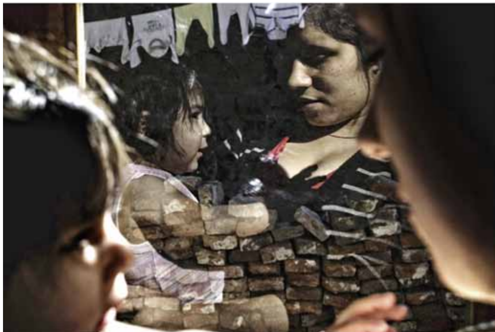
Adolescere, 2010.

groot formaat camera. Ook Yasushi Kohno schept wonderlijke werelden, al zijn die eerder surrealistisch te noemen. Sowieso gebruiken veel deelnemers aan deze expositie de fotografie als een uitgelezen middel om de werkelijkheid naar hun hand te zetten. Maar de verschillen zijn groot. De Chinees Lu Yao bijvoorbeeld maakt werk dat op het eerste gezicht sterk doet denken aan oude pentekeningen van idyllische landschappen. Kijk je beter, dan is het allemaal niet zo romantisch en zitten we midden in de 21e eeuw met zijn milieuproblemen.