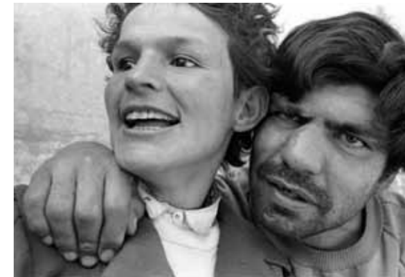
Strock of Soul, no. 29, 1994. Foto Paz Errázuriz.

Na de tentoonstelling 'Gentlemen of Bacongo' van de Italiaan Daniele Tamagni - 'een unieke combinatie van modefotografie en sociale reportage' - werd het tijd om naar de Real Jardín Botánico te gaan. Vanwege de grote drukte kost het enig geduld om de tentoonstellingszalen te