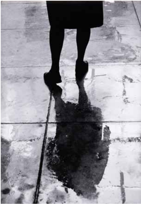
Bathed in tears # 17, 2009. Foto Helena Almeida.