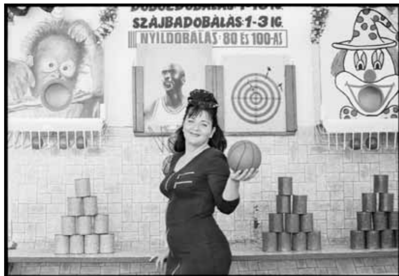
Fun Fair 1, 1997.

De dag erop sloot ik aan bij de previews voor de pers. En dat betekende dat ik in amper vijf uur tijd een stuk of zes grote tentoonstellingen bezocht. Het deed me aan een filmmarathon denken. Natuurlijk krijg je wel héél veel in korte tijd te zien maar je raakt, als het goed is, ook in een soort stemming die je nieuwsgierig maakt en houdt. De eerste gang was naar het Casa de América waar elf bekende Spaanse fotografen hun visie gaven op Cuba. De meesten deden dat in zwart-wit. Haast