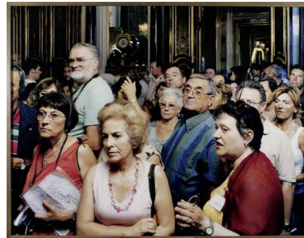
Hermitage, St. Petersburg, 2005.