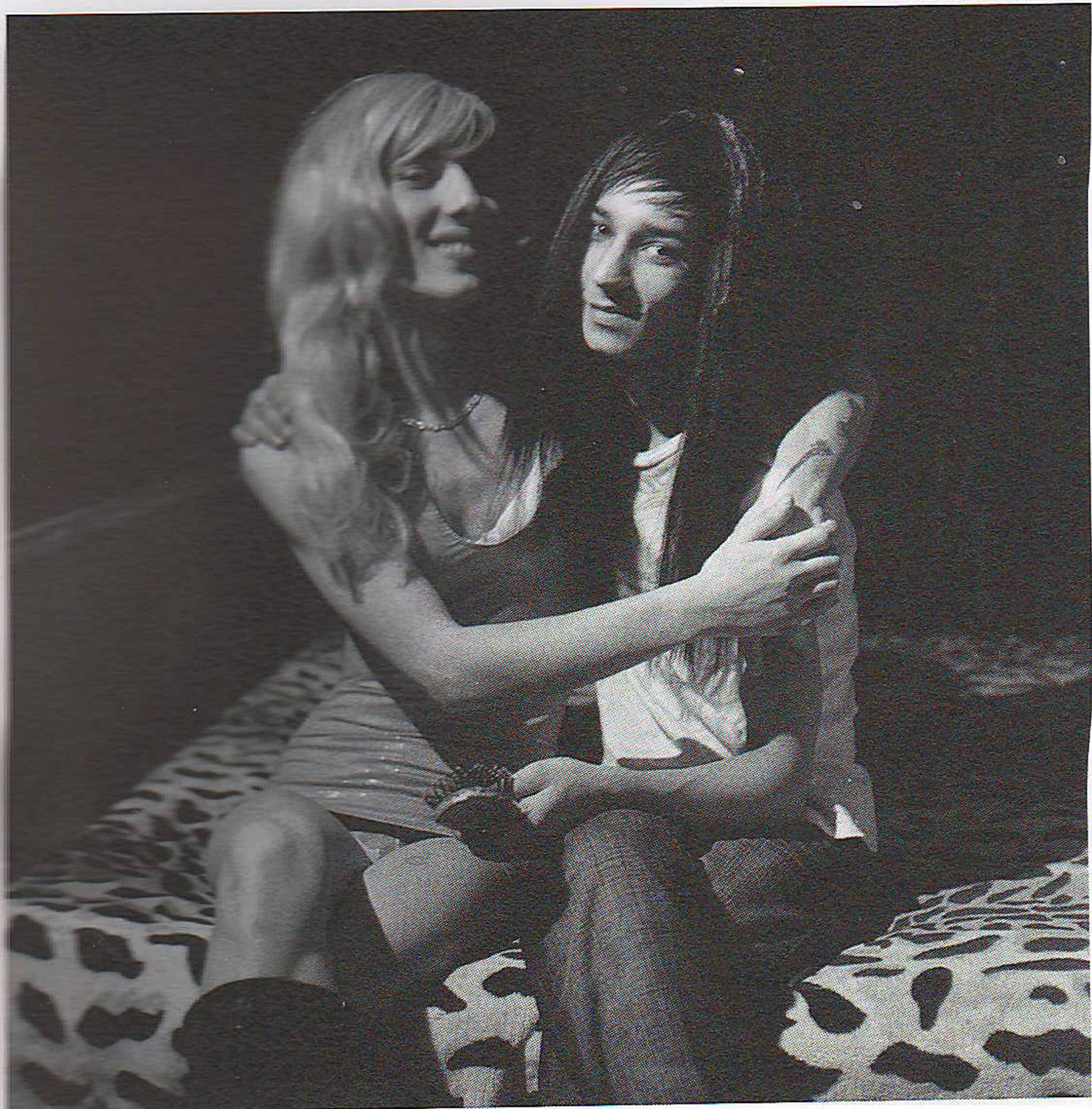
SZÁSZ LILLA Bűvölet. Sanyi és Miki, 2009, 80×80 cm, giclée nyomtat (5/1)