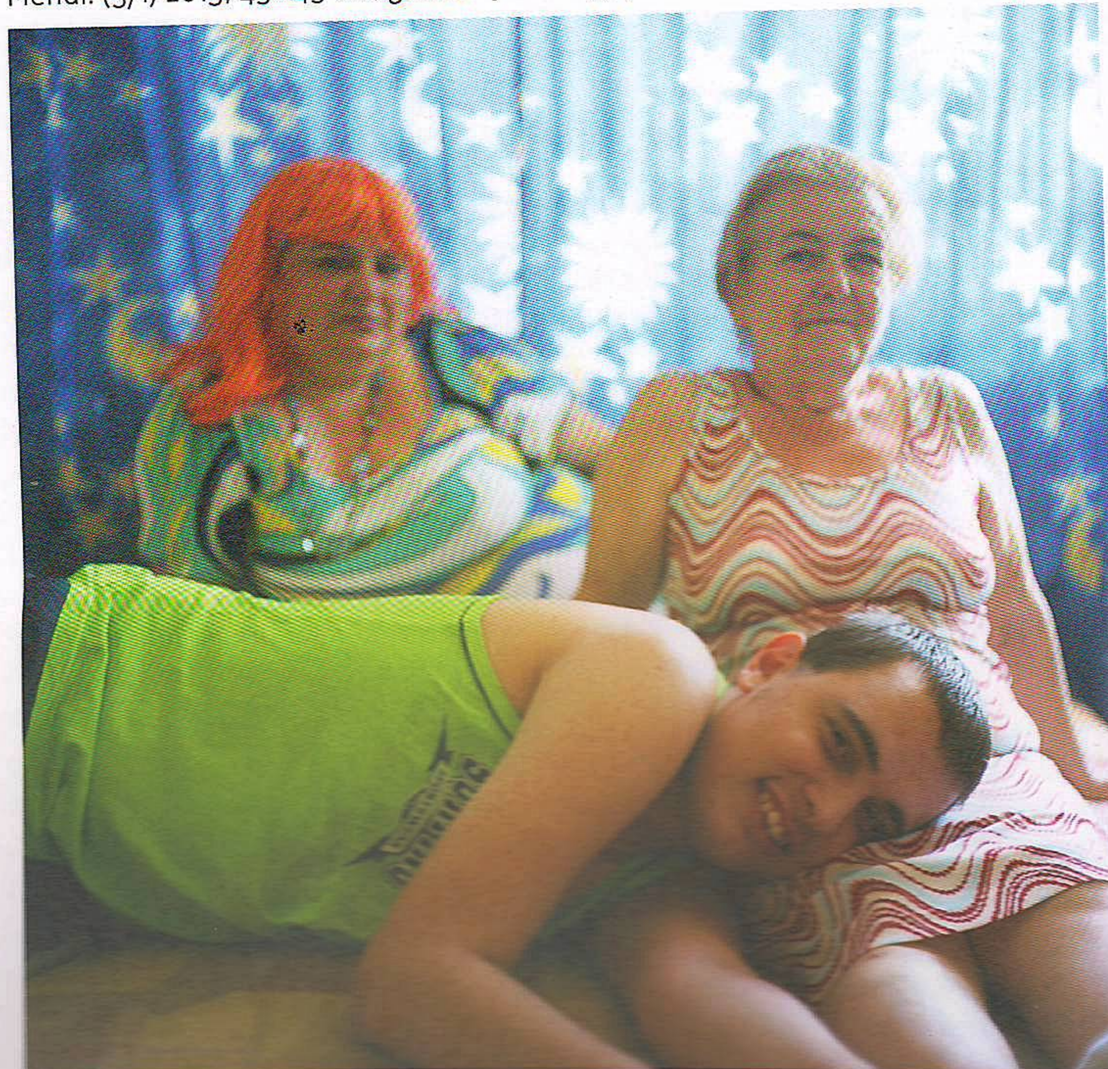
SZÁSZ LILLA Mendi. (5/1) 2013, 45×45 cm, giclée nyomtat (5/1)