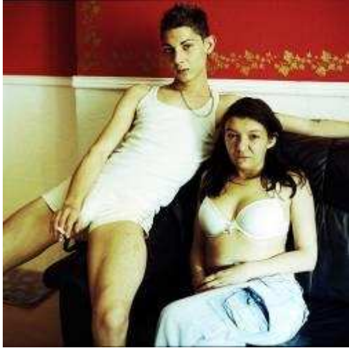
Seba Kurtis argentin fotográfus 5 évig élt illegális bevándorlóként Spanyolországban.

A Bevándorló akták című válogatás gyakran roncsolással előhívott képein új atmoszférát teremt, hogy kézzel foghatóvá tegye azt a kiszolgáltatottság felett érzett dühöt, melyet a létbizonytalanságra ítélt helyzet kivált az emigránsokból.